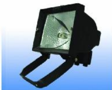
SPOTLIGHT HALOGEN 500 W.