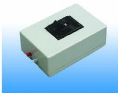
CIRCUIT BREAKER SINGLE PHASE 220 V. 50 Hz