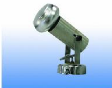
SPOTLIGHT 100 W. STANDARD