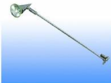
SPOTLIGHT HALOGEN 50 W.(30CM)