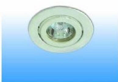
DOWNLIGHT HALOGEN 50 W.