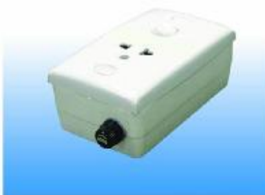
SOCKET 5 Amp (5 Amp Fuse) 220 V. 50 Hz. (Not For Lighting)