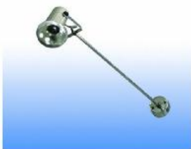
SPOTLIGHT 100 W. WITH ARM