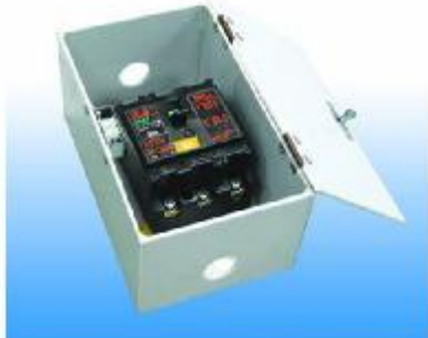
CIRCUIT BREAKER THREE PHASE 380 V. 50 Hz