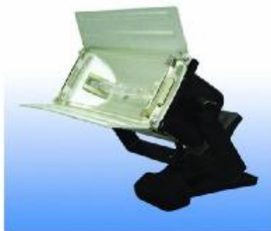
SPOTLIGHT HALOGEN 300 W.