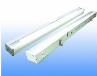
FLUORESCENT LIGHT 40 W.