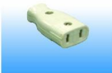
SOCKET FOR CONNECTING BY EXHIBITOR PER UNIT OF 100 W.

Queen Sirikit National Convention Center, 60 New Rachadapisek Road, Klongtoey, Bangkok 10110, Tel: 0-2229-3000 Fax: 0-2229-3144