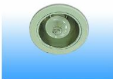
DOWNLIGHT 60 W.