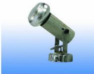
SPOTLIGHT 100 W. STANDARD