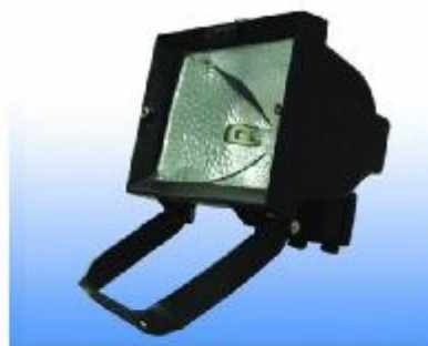
SPOTLIGHT HALOGEN 500 W.