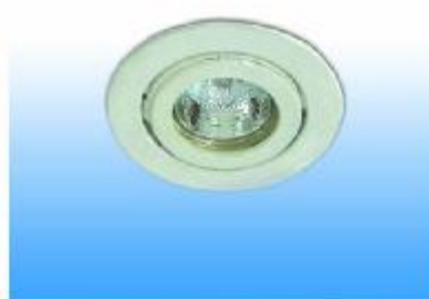
DOWNLIGHT HALOGEN 50 W.