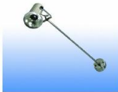
SPOTLIGHT 100 W. WITH ARM